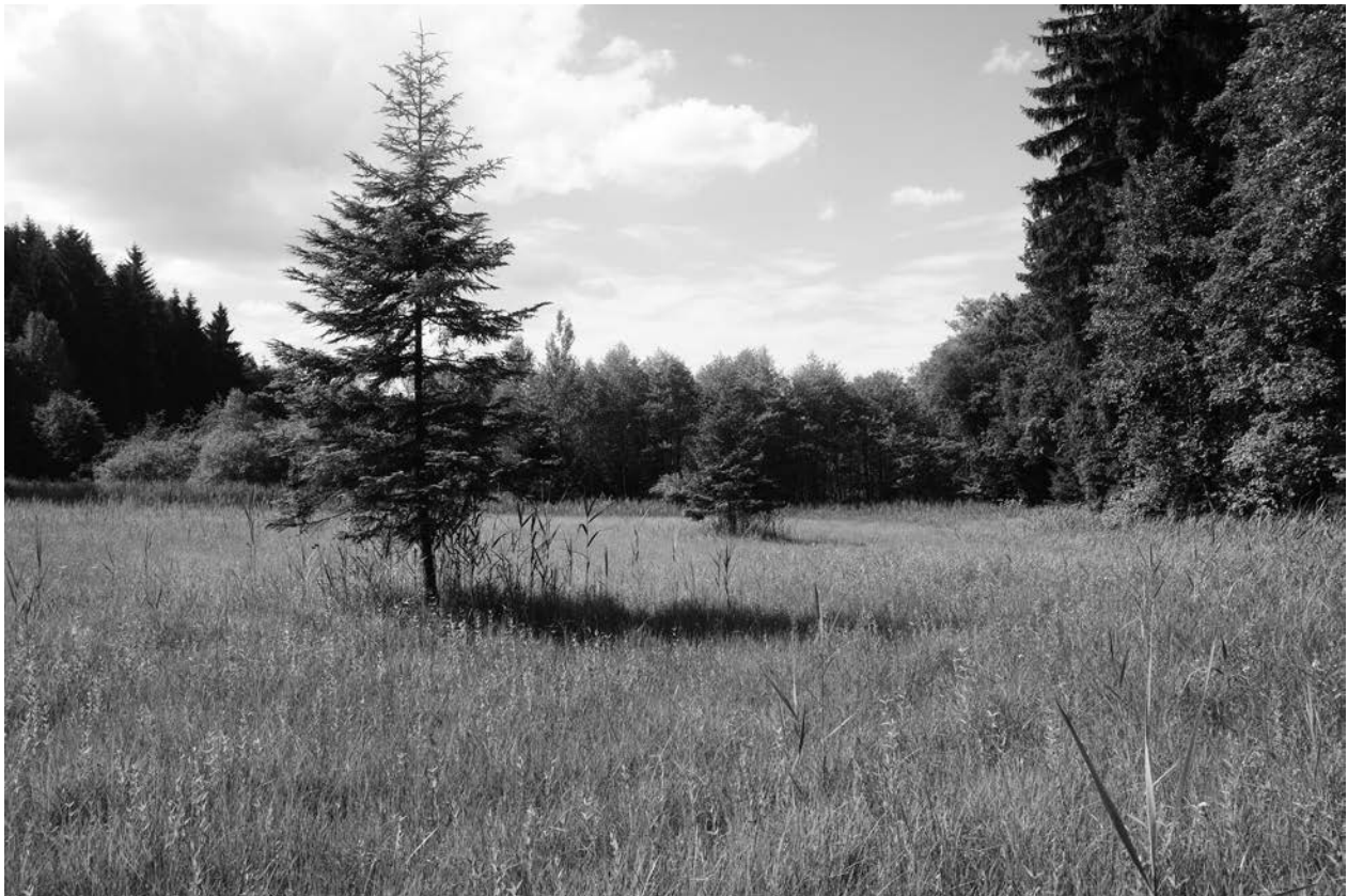
Abb. 3: Die Illinger-Streuwiese am Salzweg, aus dem Südosten in nördliche Richtung fotografiert.

antwortung zukommt. Es ist daher besonders erfreulich, dass es dem Zweitautor im Rahmen seiner beruflichen Tätigkeit als Amtssachverständiger der Salzburger Landesregierung gelang, in Verhandlungen mit dem Grundeigentümer dessen Zustimmung zu einer Ausweisung der Streuwiese als Natura 2000-Gebiet zu erreichen. Die Nominierung erfolgte noch Ende 2015. Teil der Vereinbarungen ist, dass die Biotopschutzgruppe HALM in den Jahren 2016 – 2020 auf der Illinger-Streuwiese ein Projekt zur Bestandesstützung und -stärkung der Sumpf-Siegwurz umsetzen wird. Es ist davon auszugehen, dass sich Maßnahmen, die Gladiolus palustris zugutekommen, auch auf andere wertgebende, seltene und gefährdete Arten der Streuwiesen positiv auswirken. Es bestehen also hervorragende Aussichten für eine Erhaltung der Illinger-Streuwiese als „Hotspot“ der Biodiversität am Fuße des Unterberges!